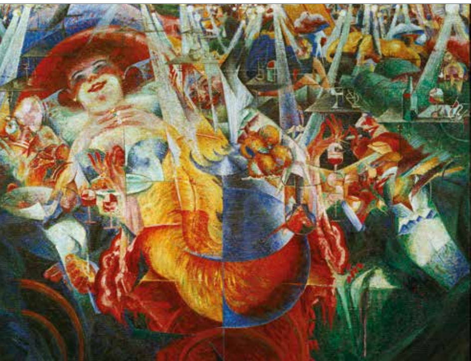
Umberto Boccioni, Râsetul , 1911, ulei pe pânză, MoMA, New York.