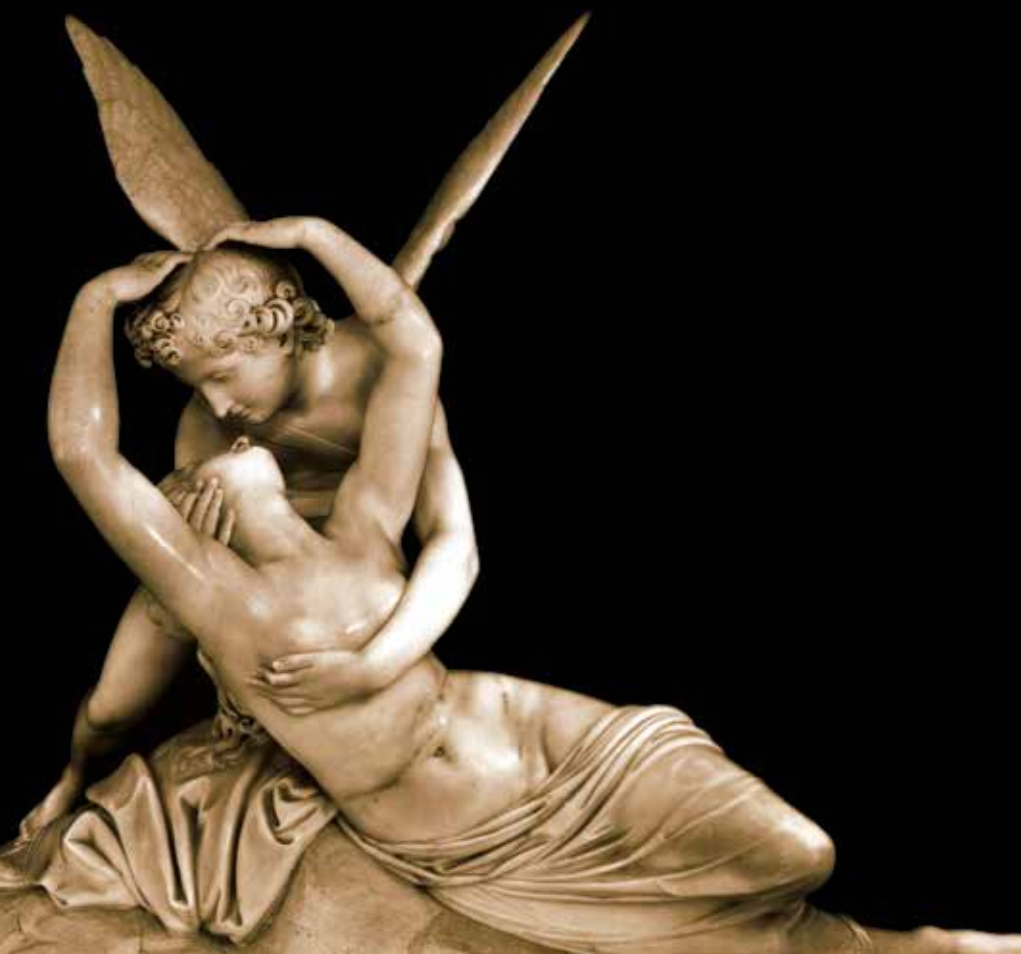
Antonio Canova, Amor și Psyche, 1787-1793, marmură, Musée du Louvre, Paris.