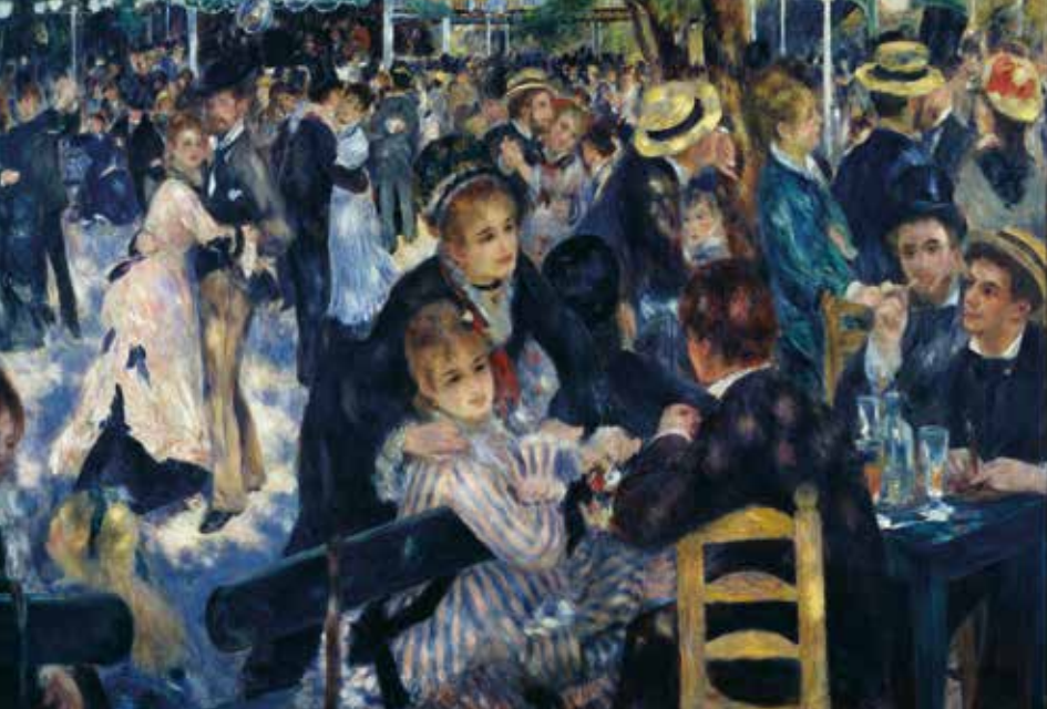
Pierre-Auguste Renoir, Bal la Moulin de la Galette , 1876, ulei pe pânză, Musée d'Orsay, Paris.