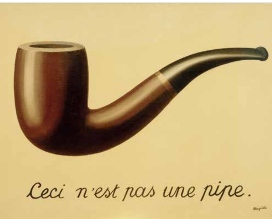
René Magritte, Trădarea imaginilor, 1928-1929, ulei pe pânză, Los Angeles County Museum of Art, Los Angeles.