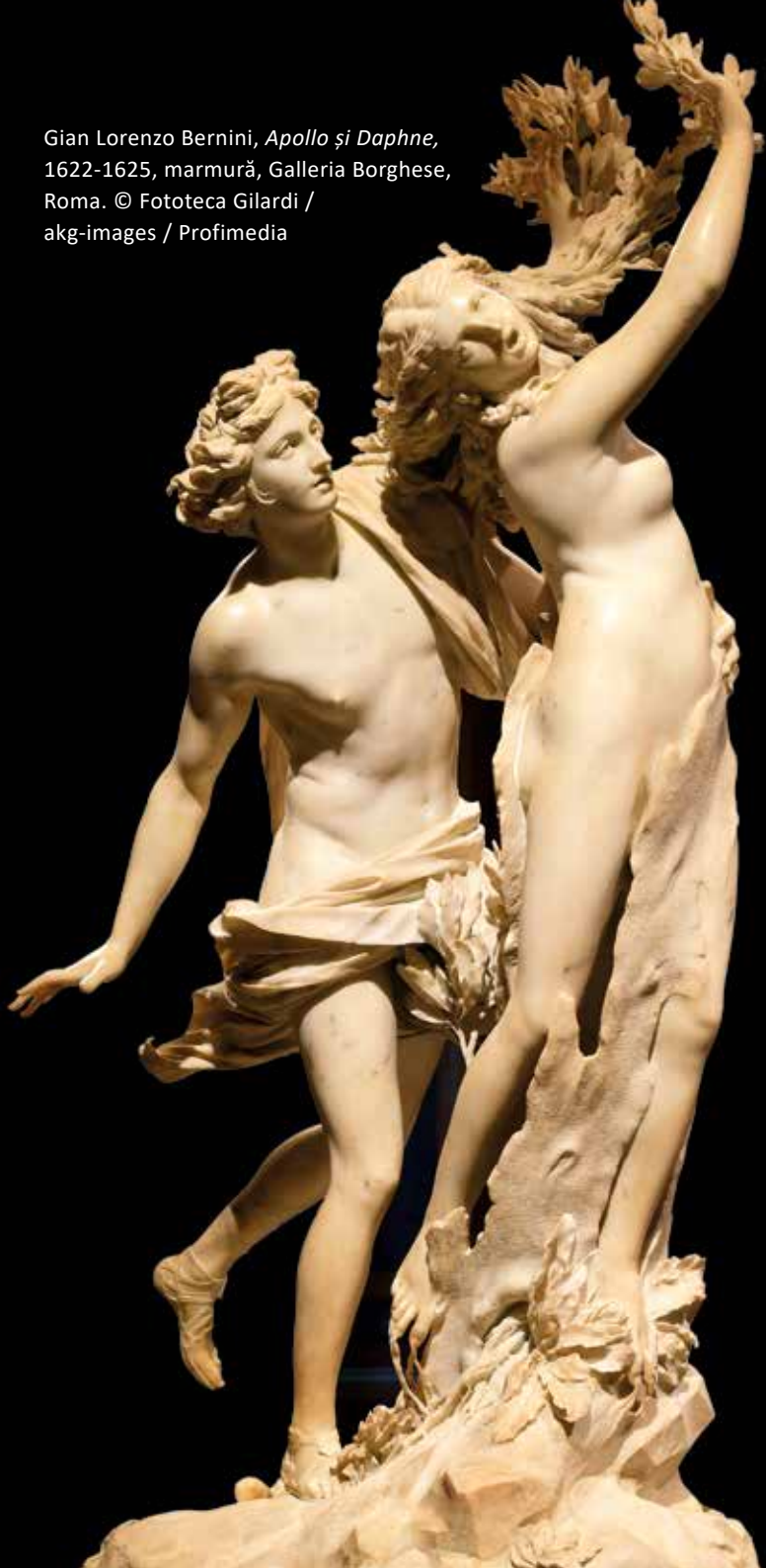
Gian Lorenzo Bernini, Apollo și Daphne, 1622-1625, marmură, Galleria Borghese, Roma.