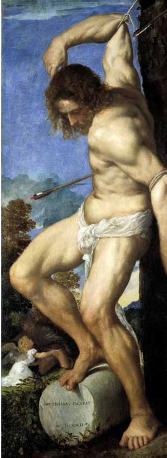
Tițian, Polipticul Averoldi, detaliu, 1520-1522, ulei pe lemn, Collegiata dei Santi Nazaro e Celso, Brescia.